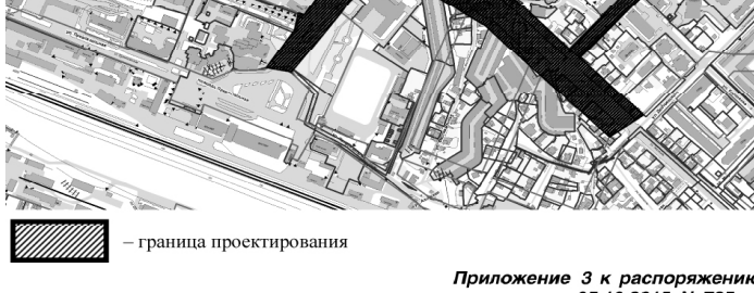
Задание на разработку документации

Приложение 3 к распоряжению от 05.10.2015 N 725-рк