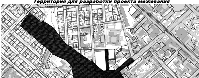
Территория для разработки проекта межевания

Приложение 2 к распоряжению от 05.10.2015 N 725-рк