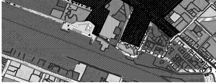
Территория для внесения изменений в ПП планировочного района N 6 «Центральный»

Приложение 1 к распоряжению от 05.10.2015 N 725-рк