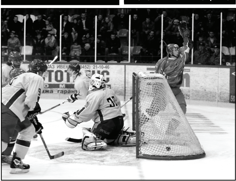
ФОТО ВИКТОРИИ ЮЩЕНКО