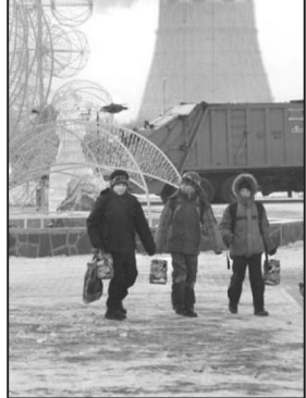
НА СНИМКАХ: так было и так стало.

— Хотелось бы привлечь к посадке деревьев и кураториков жителей округа. Ведь, если дерево посажено своими руками, за ним хочется ухаживать.