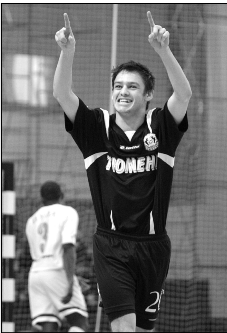
«Кольцевую композицию»: он забил нам первым и последним.