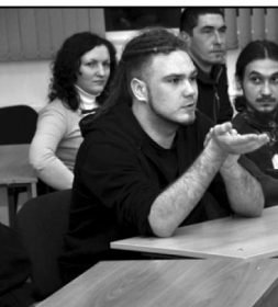
Два года назад группа энтузиастов организовала кино клуб. В основном в компании были молодые люди с антифашистскими взглядами и представителями «левых» взглядов.

Это, конечно, если повезет, если встретится достойный фильм, если тот мир, который он предложит, окажется необходим вам в данный момент. А если вы придирчивый ценитель общественно-политических фильмов? Тогда кино клуб Института истории и политических наук ТюмГУ - то, что вам нужно!