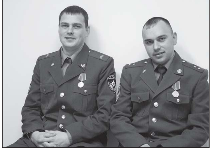
ФОТО ВИКТОРИИ ЮЩЕНКО

Уважаемые родители! В «Областном центре реабилитации инвалидов» 24 апреля состоится занятие «Родительская академия» по теме: «Трудоустройство подростков и молодых инвалидов в летнее время. Отряды мэра». Приглашаем детей-инвалидов в возрасте от 13 лет и их родителей. Начало в 15.00. Адрес: г. Тюмень, ул. Уральская, 60/1. Тел. 43-13-53. Место проведения: 14 каб. (на 2-м этаже).