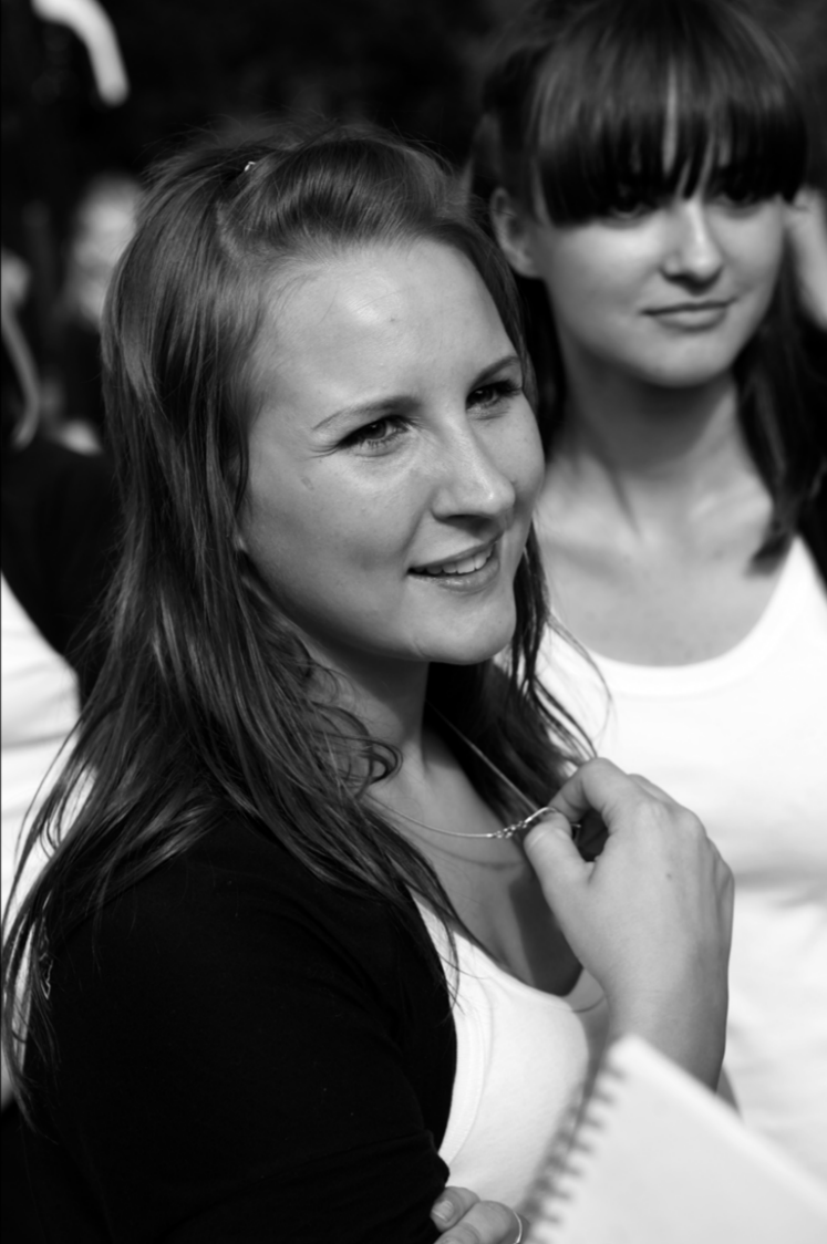
... А мама сына рисовала

Наши корреспонденты ведут репортаж с площадок Дня молодежи