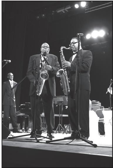
НА СНИМКЕ: играет оркестр Дюка Эллингтона.

... А те, что вовремя не сообразил, что исполнители запросто вернутся, спустятся в зал, чтобы познакомиться с публикой, дать автографы, сфотографироваться на память, кусали потом локти.