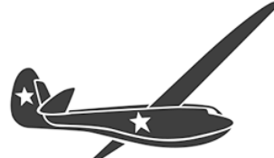
Десантные планеры А-7, планер «Крылья Танка-60»