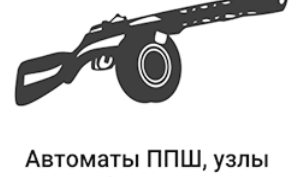
Автоматы ППШ, узлы для телефонных катушек