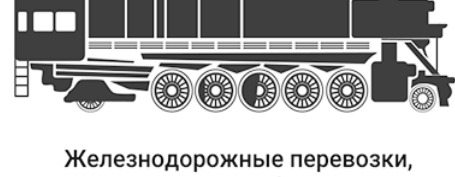
Железнодорожные перевозки, минометы и мины калибра 50 мм и 82 мм