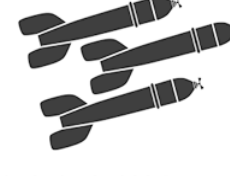
Стальные головки реактивных снарядов РС-13, мины калибра 82 мм