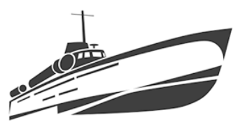
Торпедные катера, снаряды для «Катюш»