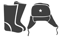
Валенки, полушубки, шапки-ушанки, меховые рукавицы, погоны, гимнастерки, шаровары