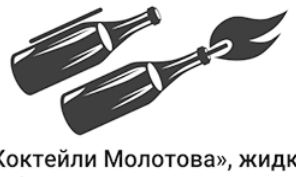
«Коктейли Молотова», жидкий бакелит различных смол