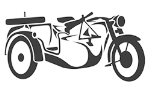
Тяжелые мотоциклы, детали для взрывателя КТМ-1