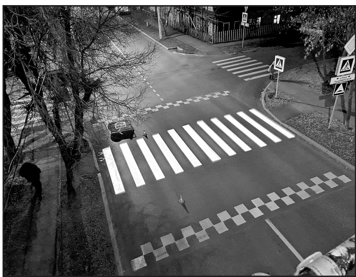
Комитет по связям с общественностью и СМИ администрации города Тюмени

В минувшем году была продолжена и работа по повышению культуры поведения участников дорожного движения в рамках концепции «Тюмень – город культурных дорог». Перед пешеходными переходами было нанесено 479 мотивационных надписей: «Смотри дважды!», «Пешеход, смотри по сторонам!», «Возьмите ребенка за руку!» и другие.