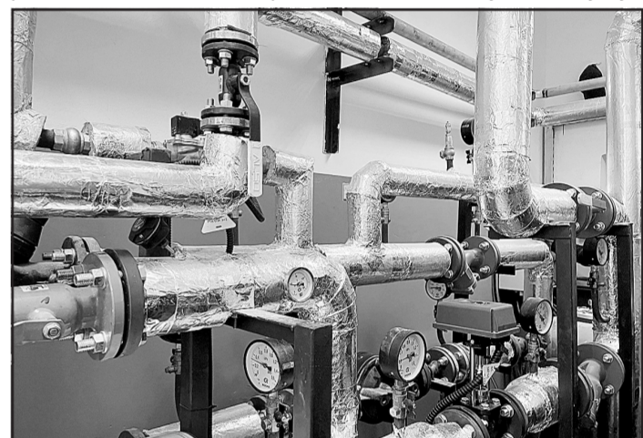
Комитет по связям с общественностью и СМИ администрации города Тюмени

Кроме этого, на базе МКУ «ЕЦОР» активно внедряются современные сервисы информационного взаимодействия с гражданами, например, автоматизированная диалоговая нейросетевая система, представляющая собой робота-оператора и виртуального помощника, решающего вопросы и синтезирующего ответы на заданные вопросы. Система способна в режиме 24/7 отвечать на вопросы жителей по отключению коммунальных ресурсов (электроснабжение, горячее и холодное водоснабжение), назвать причины отключения и сроки проведения восстановительных работ. Это позволяет обеспечить оперативное информирование тюменцев по вопросам оказания коммунальных услуг.