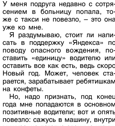
ФОТО ИИ ШЕДВРУМ

– Маршрут известен заранее, но перед выездом дают задание: когда выезд, во сколько и где забрать музыкантов и артистов, во сколько быть на первой площадке, на второй и так далее. Все и рассчитываешь. Прийти надо, конечно, пораньше, проверить автобус, чтобы все в порядке было, чтобы не сломался во время выступления. Потому что, если вдруг такое произойдет и придется автобус заменить, то другой уже будет не Дедморобус, будет обычный автобусом, не украшенным по-новогоднему. А этого допустить нельзя, чтобы не было испорчено настроение у детей, у взрослых, кто его ждет. Сколько лет наш парк участвовал в этом, ни одной