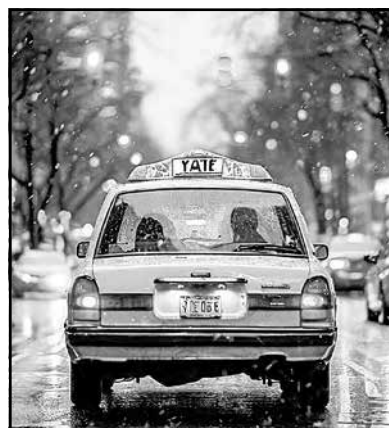
ФОТО ИИ ШЕДВРУМ